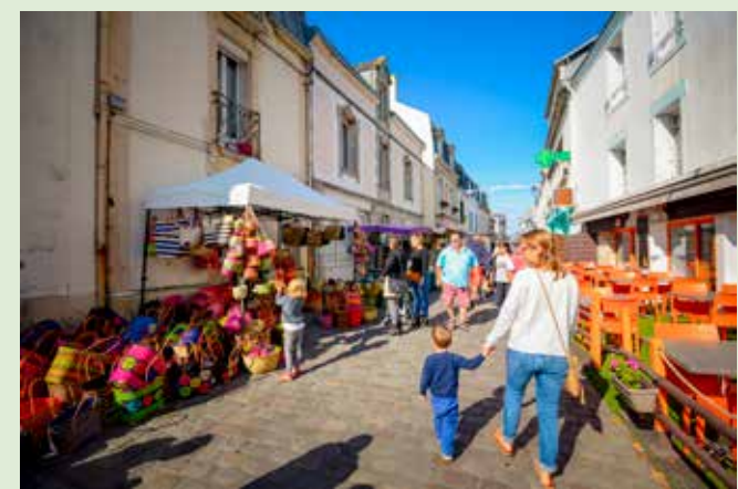
Port-Louis est une ville commerçante, une cité vivante où les échoppes de créateurs, de produits du terroir, les galeries d'artistes et les restaurants vous accueillent toute l'année. La présence artistique, culturelle et patrimoniale vous incitera à vous arrêter autour de la découverte de cette presqu'île d'environ 1 km², riche en diversité et qualité.

Ce circuit d'interprétation du patrimoine architectural vous invite à découvrir l'histoire de la cité. 21 stations historiques dans la ville se succèdent sur une promenade que vous ferez à votre rythme.