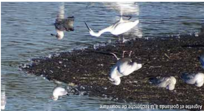
Algrette et goélands à la recherche de nourriture