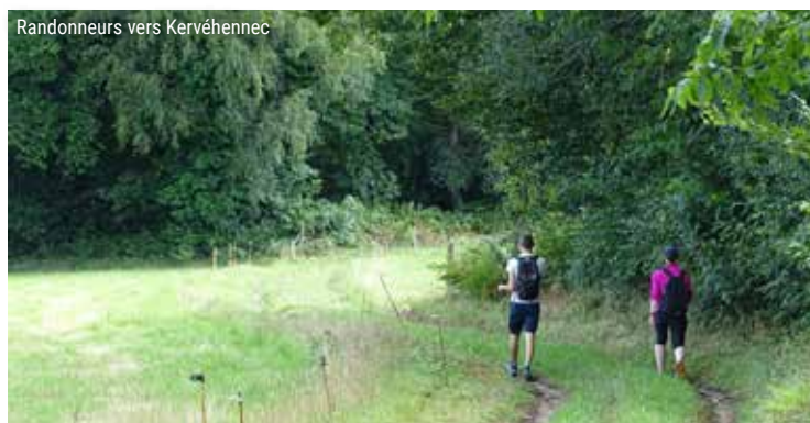
Randonneurs vers Kervéhenec

6 Virez à gauche à l'entrée du hameau. Restez sur le chemin parallèle à la route. Au bout, remontez à gauche puis allez à droite et à gauche pour suivre la D 327. Marchez sur le bas-côté et longez le Blavet. A la balise, remontez à gauche vers Poul Fetan sur le chemin en lacet. Virez à droite sur le promontoire et poursuivez en face après le ruisseau, puis tout droit dans la lande et sur le large chemin en ignorant les chemins à gauche. Entrez dans le bois à gauche et reprenez à gauche pour rejoindre le Hévédic et Poul Fetan (trois fois à gauche).