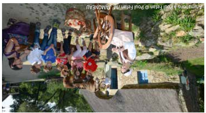
Animations à Poul Fetan

Circuit inscrit au Plan Départemental des Itinéraires de Promenade et de Randonnée